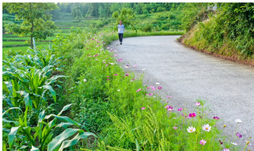
石宝镇云山村,村民行走在刚建成不久的道路上。

出栏20多头生猪,加上种植业,一年有10多万元的收入。”乌杨街道黄谷社区四组建档立卡贫困户杜洪平说,以前当地的道路为泥结石路,一遇下雨天,泥泞道路导致出入非常