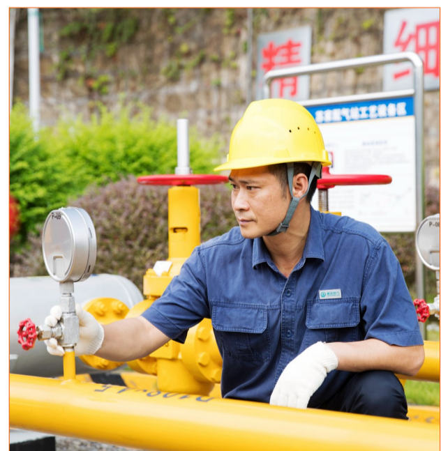
燃气工人检修管道。