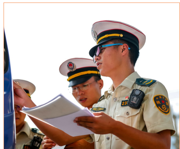
交通执法人员检查过往车辆。