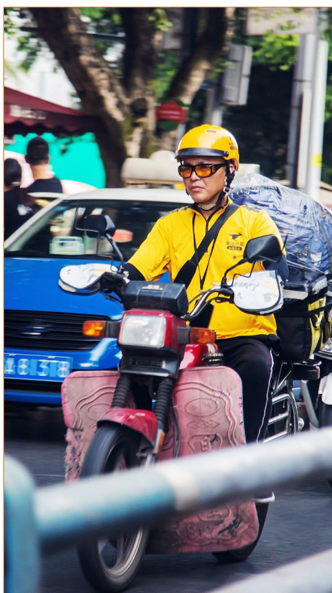
外卖小哥穿梭在街头巷尾。