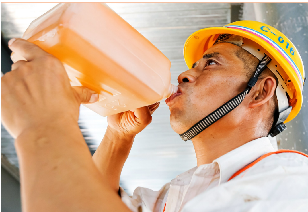
建筑工人饮水解渴。