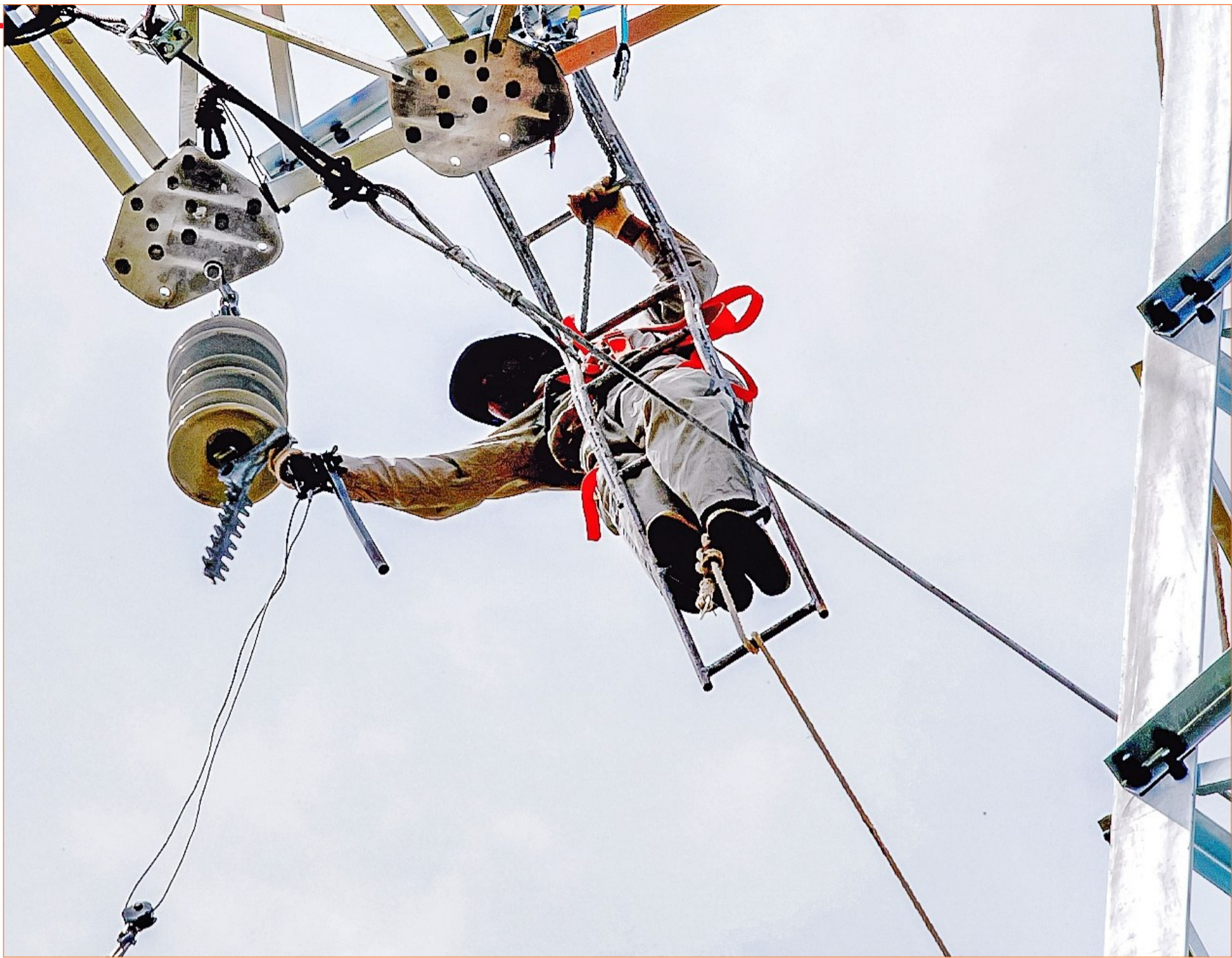
烈日下的电力“飞行侠”。