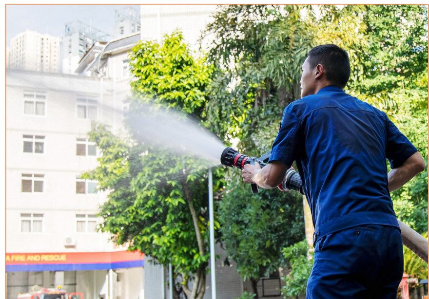
烈日下，消防救援演练不停歇。