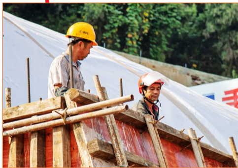
建筑工人在烈日下浇筑混凝土。