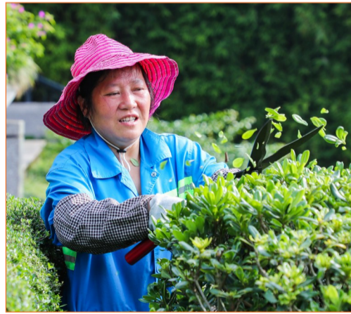
园林工人为花草修枝。