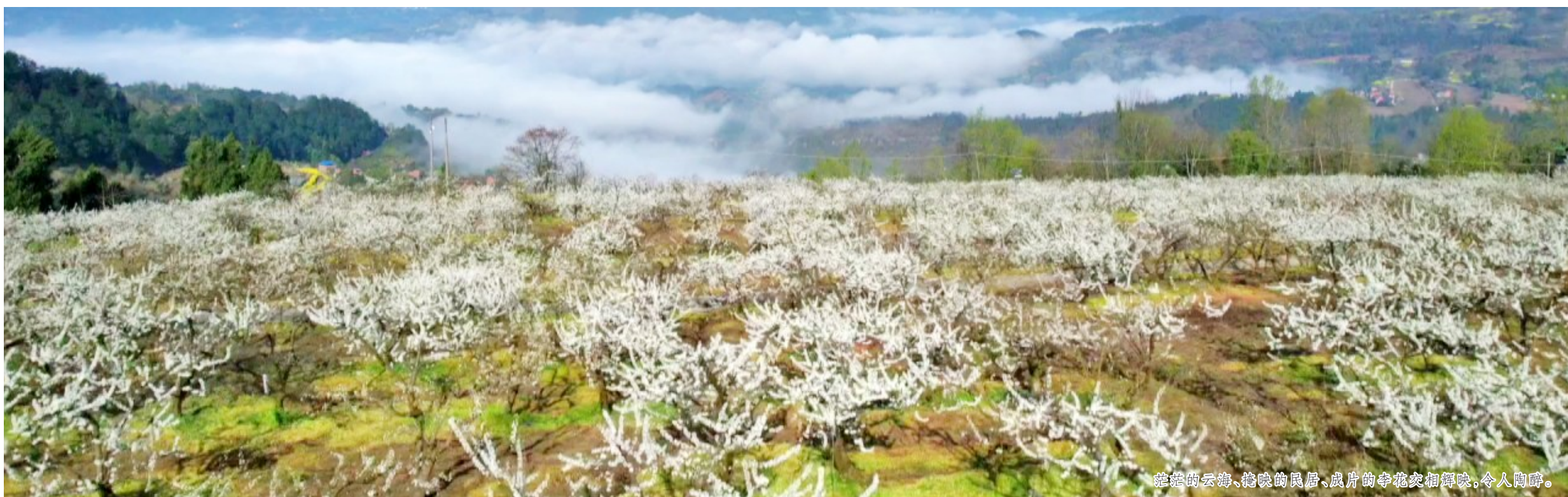
茫茫的云海、掩映的民居、成片的争花交相辉映,令人陶醉。