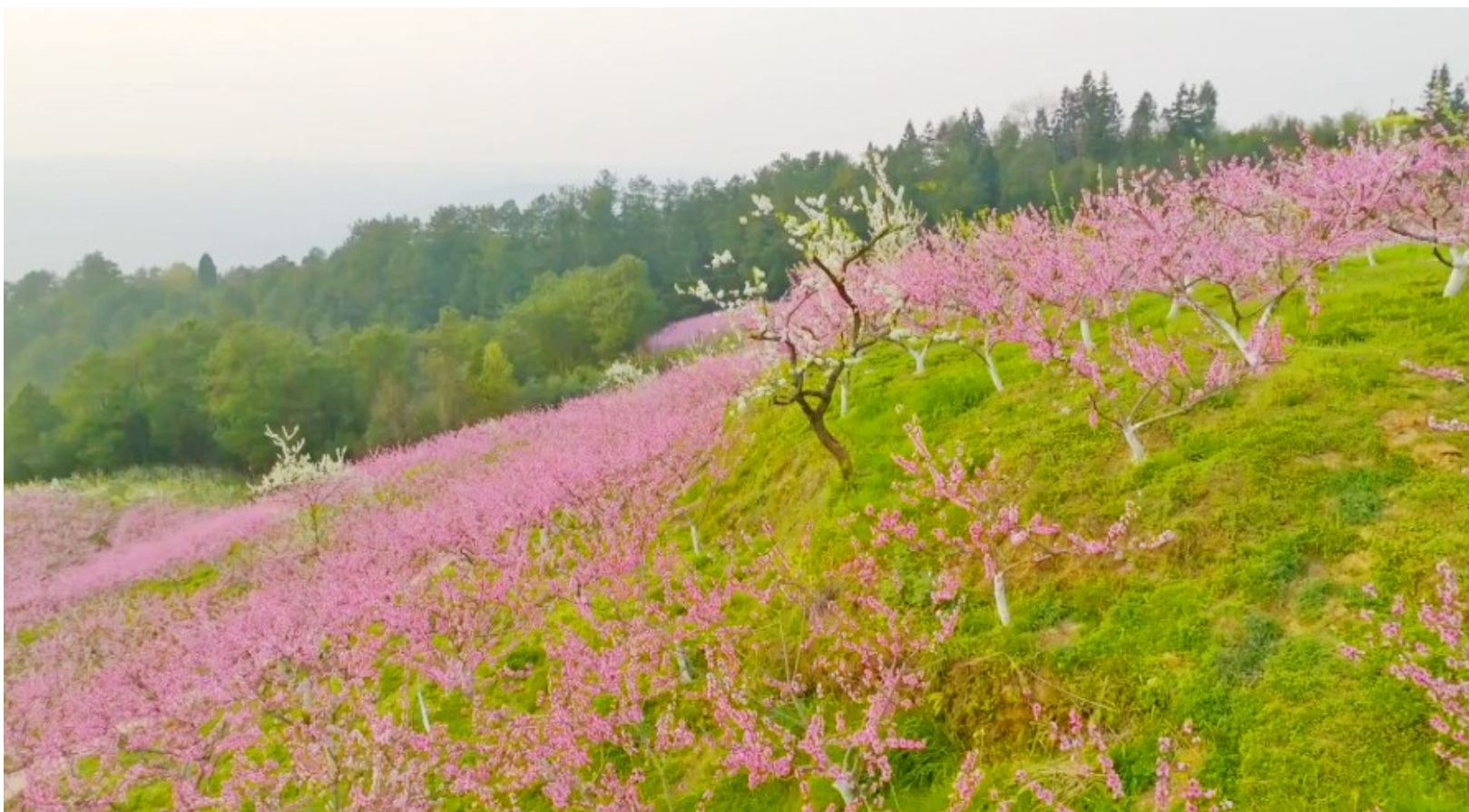
桃花开了,满山姹紫嫣红,远远望去,似乎大地铺上了一层粉纱。