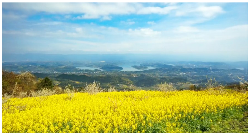
蓝天白云下,青山绿水间,一片片金黄的油菜花,在阳光照射下光彩夺目。