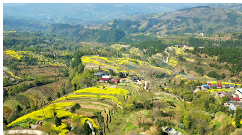
层层花海错落有致,如锦似绣,似一幅绚丽多彩的生态画卷。