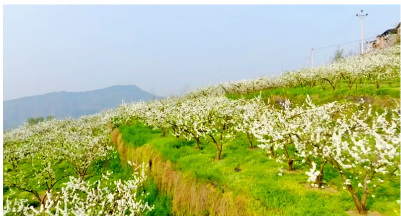
一树树洁白的李花繁茂如雪,瓣瓣芳蕊傲立枝头。