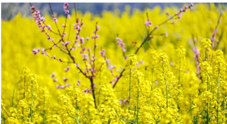
金黄的油菜花、粉红的桃花共同构成一幅美丽的图案。