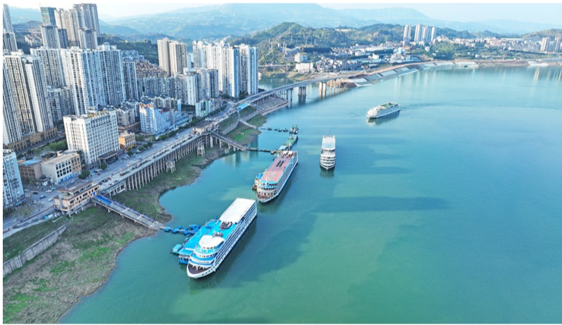
一艘艘轮船不时从远方驶来, 最终安静地停靠在泊位上。