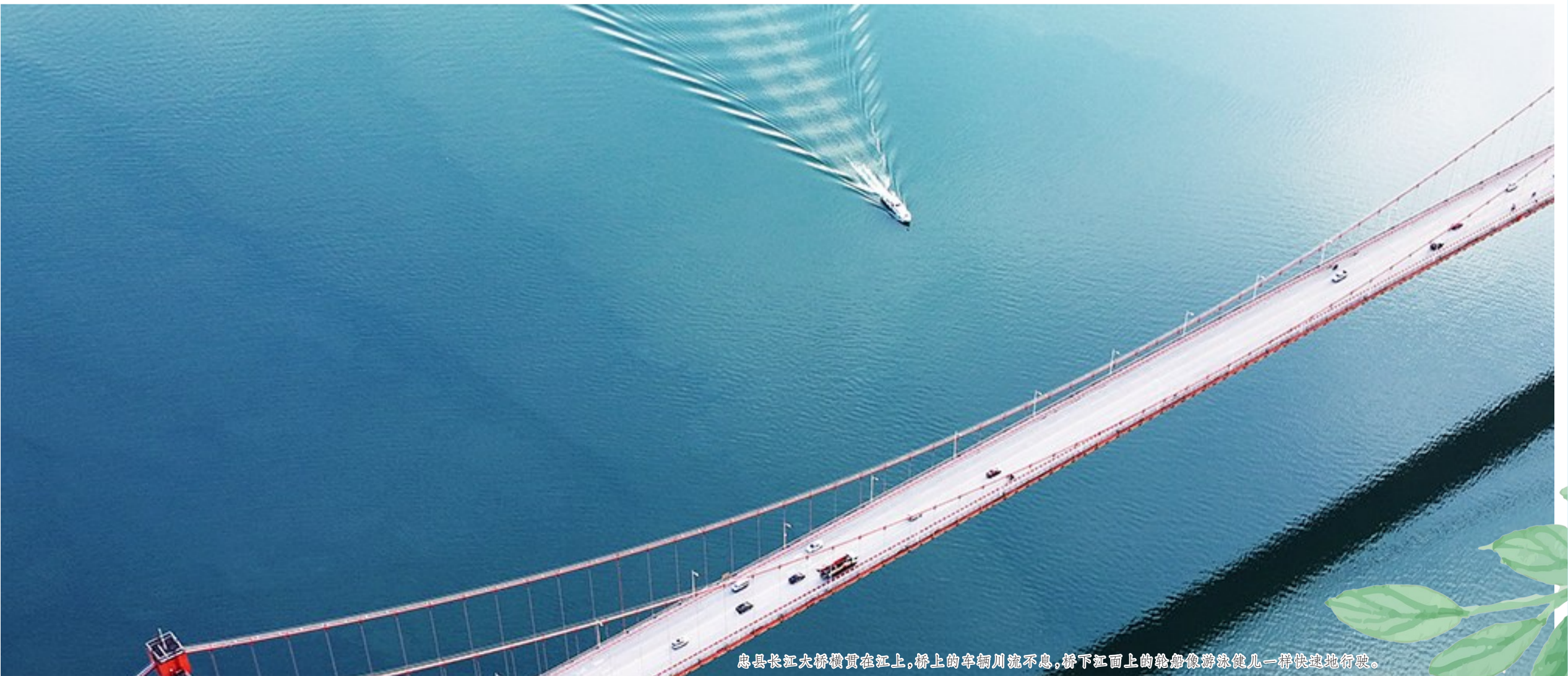
忠县长江大桥横贯在江上, 桥上的车辆川流不息, 桥下江面上的轮船像游泳健儿一样快地行驶。