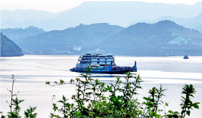
远山、轮船、江面共同构成一幅美丽的山水画。