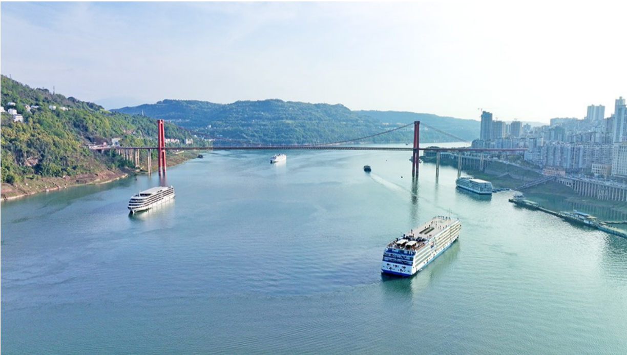
洒满金色阳光的江面上, 时不时驶过一艘艘轮船。