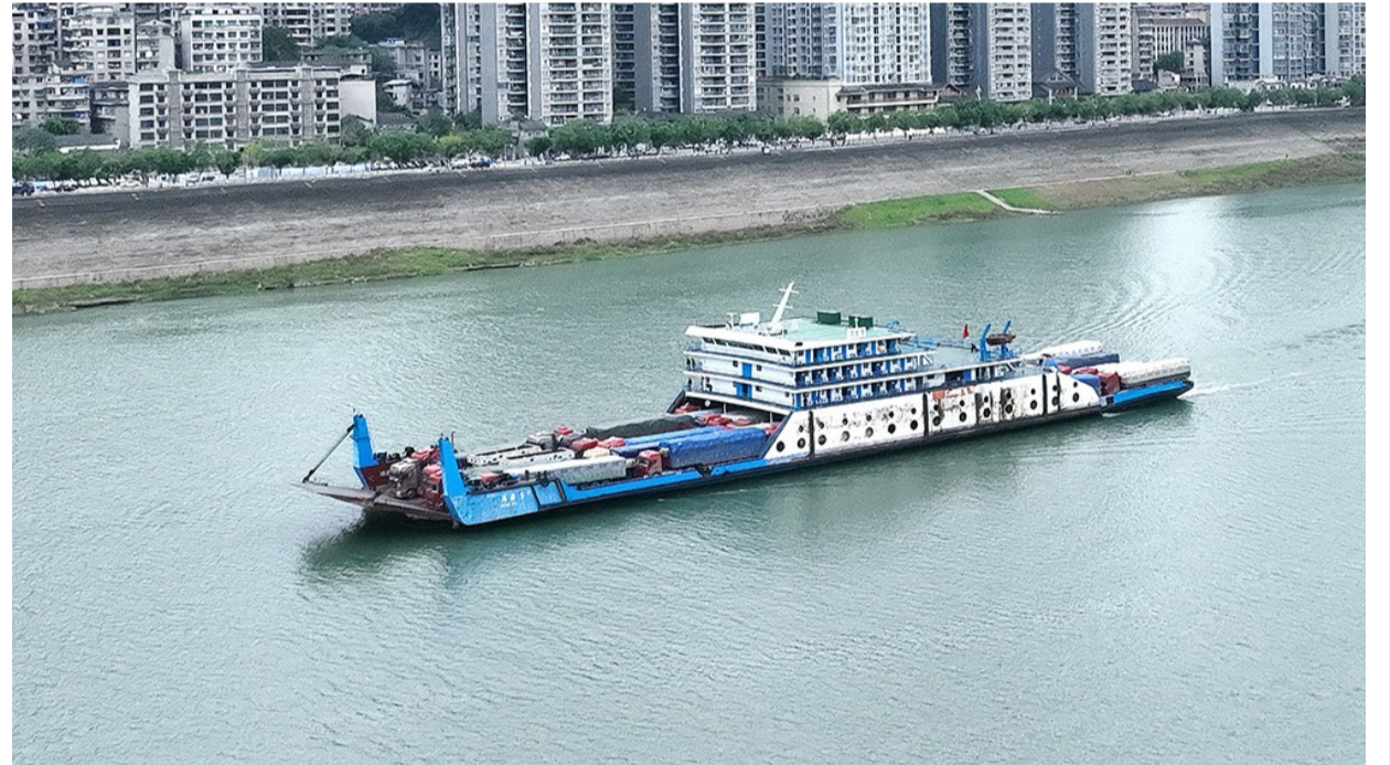
一艘滚装船装着满载货物的大型货车在临江路段江面上行驶, 为平静的江面增添了不少生机。