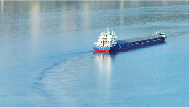
一艘轮船行驶在波光粼粼的江面上。