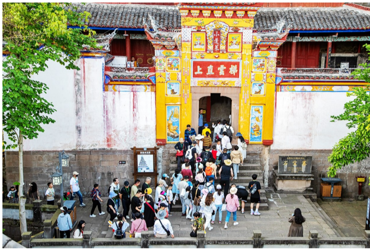
“五一”期间,石宝寨景区游人如织。

“五一”期间,忠县多家A级景区正常开放,其他景区实现应开尽开,同时开展了采桑节、草莓节等乡村旅游节会活动,多点发力撬动假期文化旅游消费市场。其中,《烽烟三国》接待游客0.78万人次,接待收入54.1万元;石宝寨景区接待1.3571万人次,接待收入36.47万元;白公祠文博景区接待0.7817万人次,接待收入2.97万元;三峽橘乡田园综合体接待11.35万人次;马灌镇灌湖水乡景区接待0.14万人次;拔山镇阿金河景区接待8万余人次;黄金镇佛耳岩景区接待0.19万人次;忠州老街接待约4.5万人次。此外,忠县累计接待过夜游客1.0182万人次,海新、香枫山等酒店持续爆满,星级酒店5天平均入住率达87.2%。