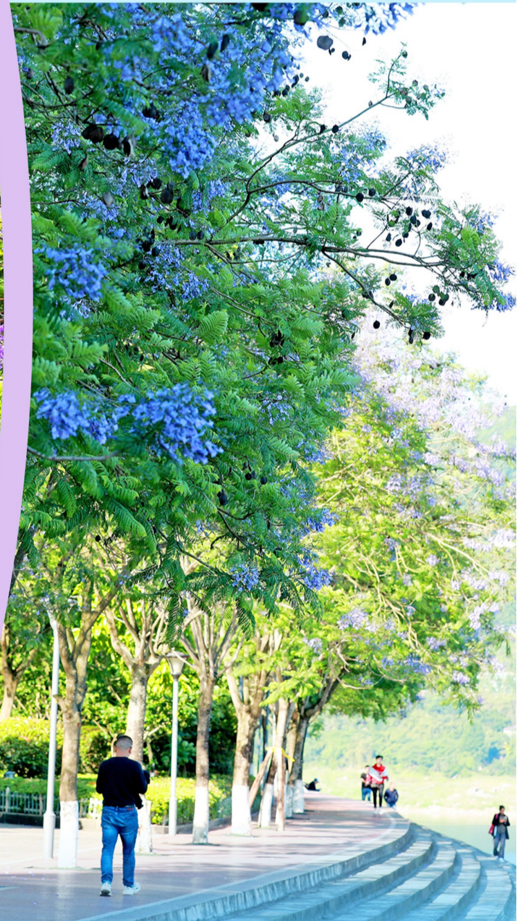
花朵将整棵树、整条道路染成一片蓝紫色，缓步行走在蓝花楹树下，仿佛徜 徉在蓝色梦幻花海中。