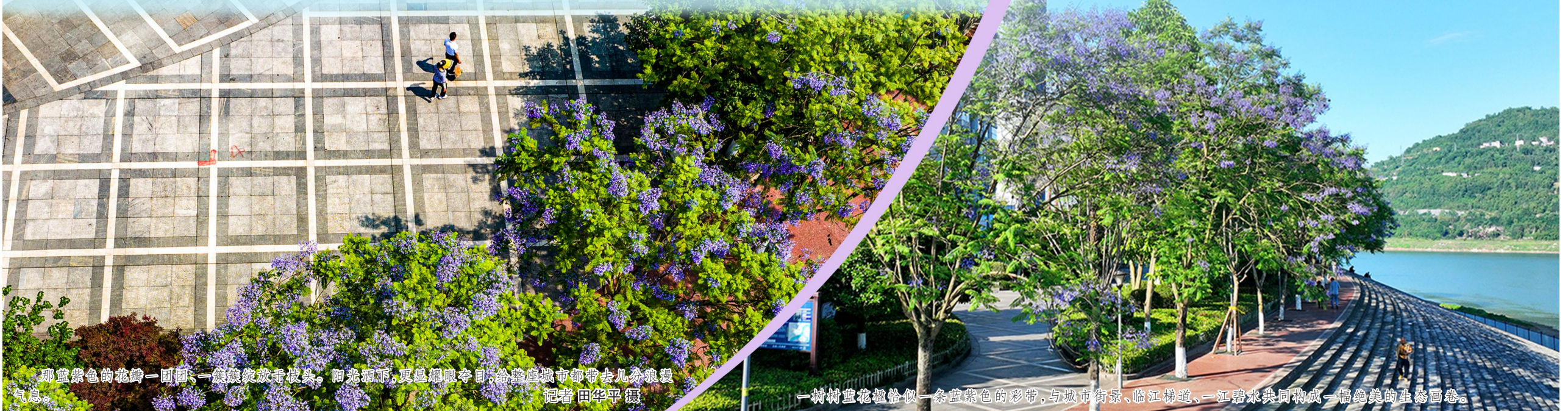
那蓝紫色的花瓣一团团、一簇簇绽放枝头，阳光下，更显得耀眼夺目，给这座城市都带去几分浪漫 气息。