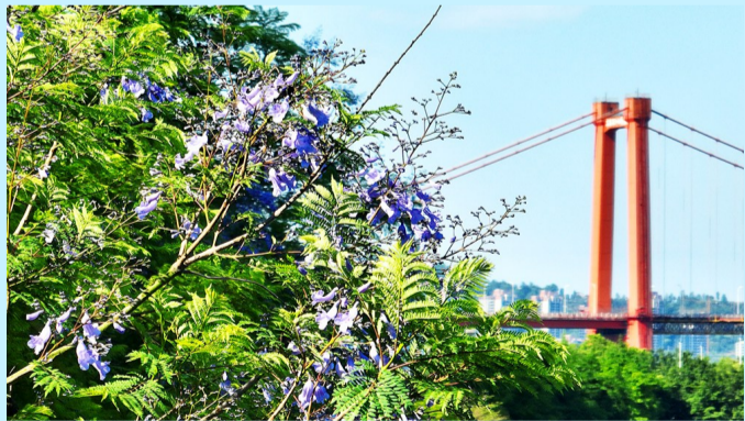
绿色的叶子中缀满蓝紫色的花，将远处的忠县长江大桥装 扮得美轮美奂。