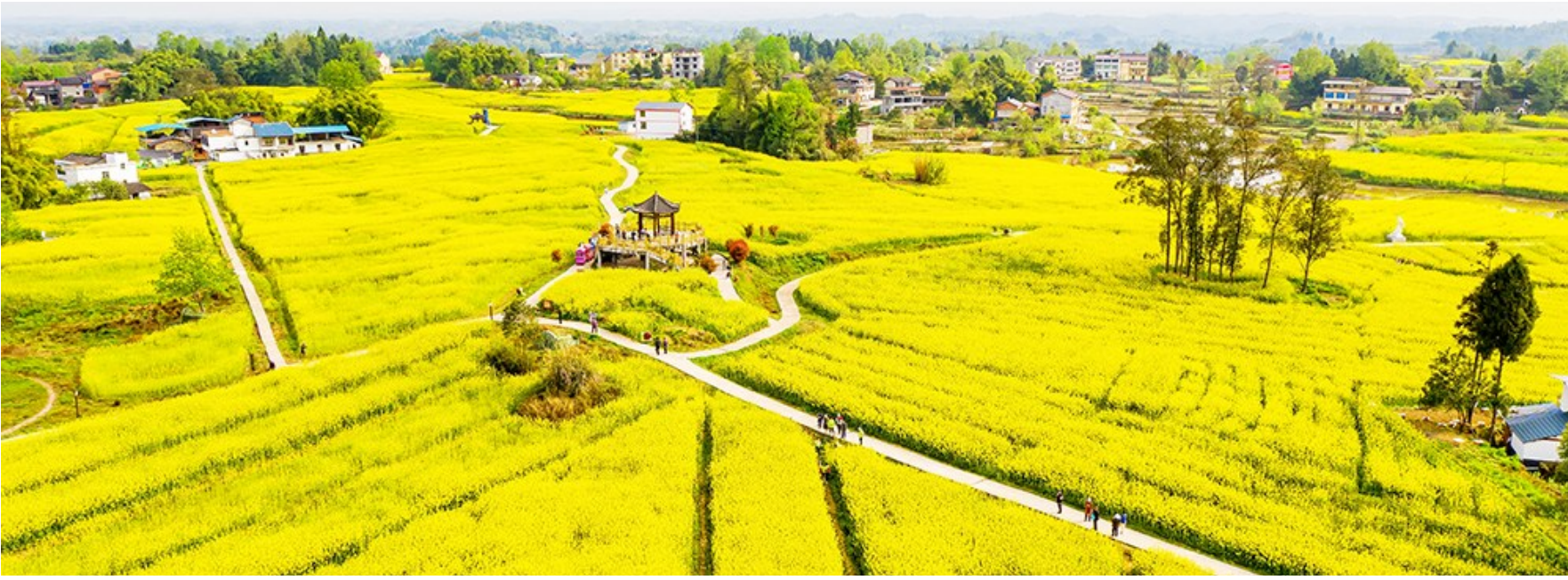
每年三四月,马灌镇“灌湖水乡”景区油菜花竞相绽放,将乡村装扮得格外美丽。

道路越修越宽、环境越来越美、群众生活条件越来越好……近几年,马灌镇发生了翻天覆地的变化,而这些都是马灌镇全面加强基础设施建设、大力推进民生工程、深入推进乡村旅游发展而结出的累累硕果。