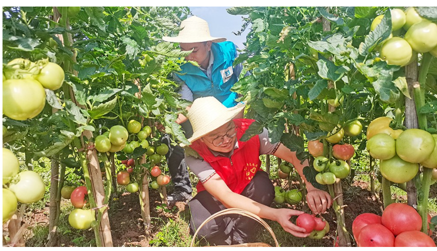
工作人员帮助村民采摘成熟的西红柿。

此外,为让助农活动可持续,中建二局西南公司忠县安置房项目联合团县委成立“1+1助农工作室”,培养乡村振兴人才,厚植爱农情怀,并派志愿者收集附近村民急难愁盼问题,定期开展助农活动,用联建共建画出最大“同心圆”,为乡村振兴贡献青春力量。