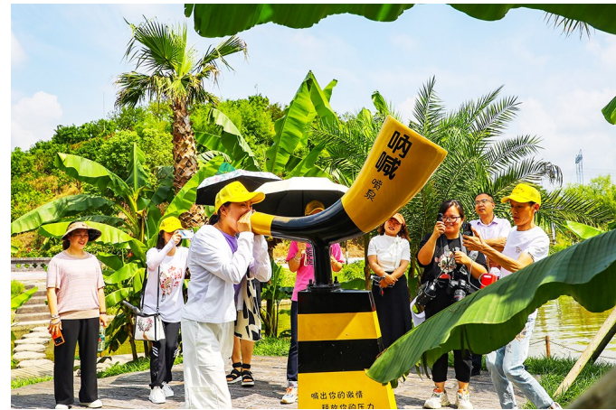
网络媒体达人沉浸式打卡体验呐喊喷泉。

本报讯(记者 田华平)乘竹筏、赏夏荷、拍视频、品美食……6月20日,以“乡约拔山镇·网游阿金河”为主题的网络宣传活动在拔山镇阿金河乡村公园举行,县内10余家网络媒体达人沉浸式打卡体验,探访人文之韵、感受乡村之美,宣传推介拔山镇。