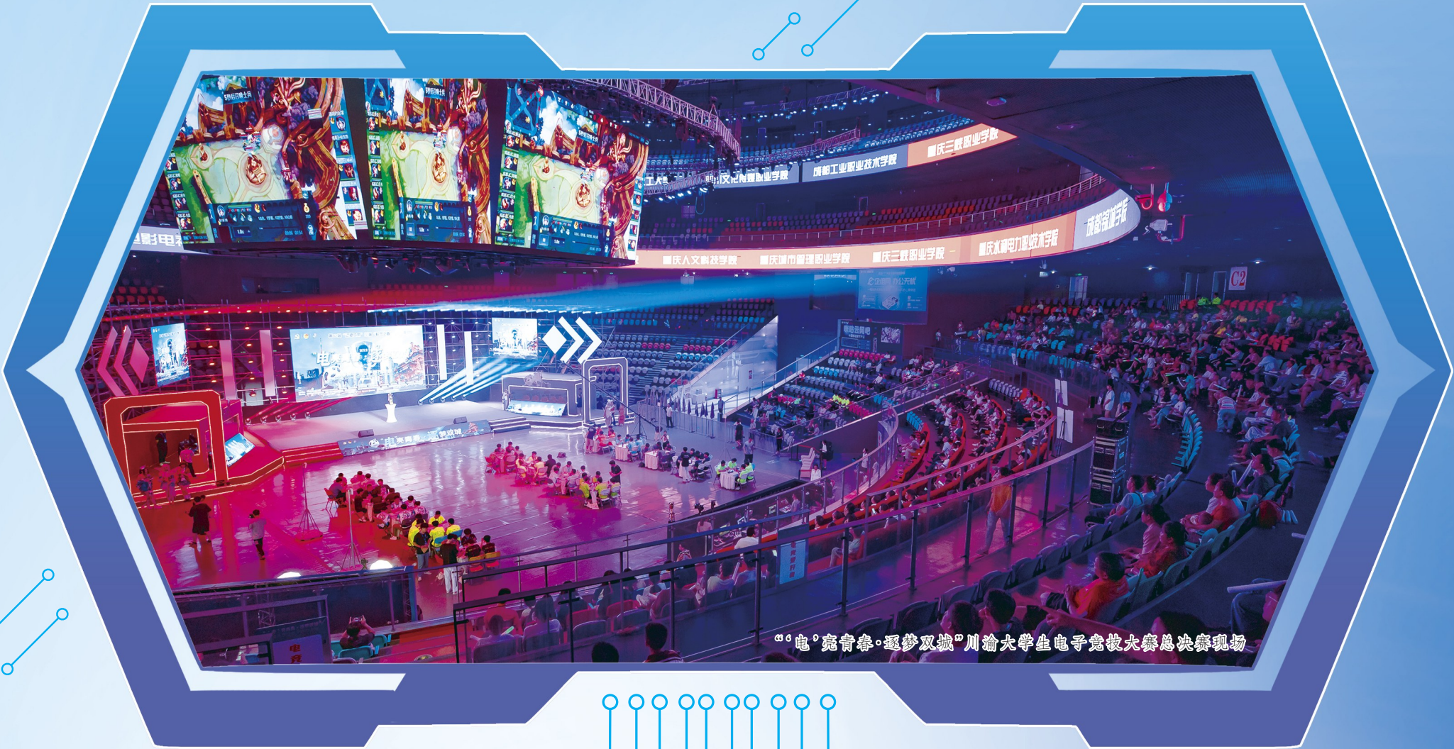
“电·亮青春·逐梦双城”川渝大学生电子竞技大赛总决赛现场

这次来忠县参加比赛,我有三个惊喜:第一个惊喜是这里的风景优美,让我领略了这座小山城的美丽;第二个惊喜是我第一次见到三峡港湾电竞馆这么壮观宏大的场馆,非常震撼;第三个惊喜是场馆内的音响和灯光效果特别好,让我享受到非常愉快的体验。