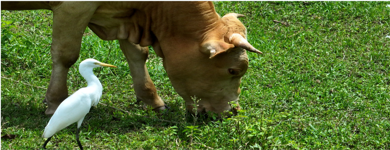
牲畜、鸟类和谐相处。