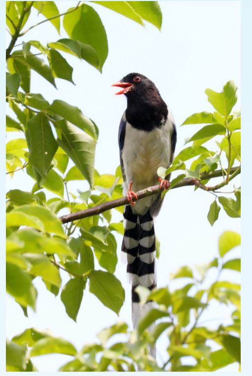
一只红嘴蓝鹤在枝头歌唱。