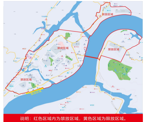
忠县禁限放烟花爆竹区域图示

内;饮用水源保护区内,输变电设施安全保护区内;医疗机构、幼儿园、学校、养老机构;化粪池、沼气池、地下管网;森林、草原等重点防火区;法律、法规、规章规定禁止用火的其他区域或者场所。 依据《条例》相关规定,任何单位和个人有权劝阻和向公安、应急、市场监管、供销等部门举报违反《条例》的行为。举报电话:公安110、应急局12350、市场监管局12315、县供销社54232571。对违反《条例》等法律法规规定的行为,依法追究当事人责任;构成犯罪的,依法追究刑事责任。