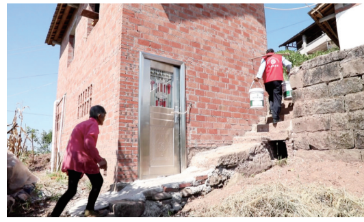
志愿者为行动不便的缺水户送水到家。