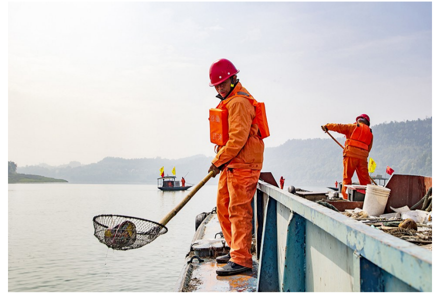
工人在进行清漂作业。

城区水域清漂和公厕管理也是县住房城乡建委环卫中心的工作。长江忠县段88公里水域、12条一级支流水域是清漂作业范围。“涨水季节,每天都要派出一艘全自动打捞船、6艘人工打捞船进行水面拦截式打捞。”开展水