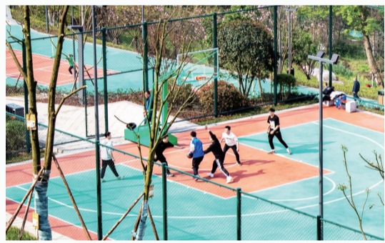
香山体育公园运动设施齐备。

打球的、放风筝的、晒太阳的、玩泥沙的……一到节假日，忠县各个公园便成为市民休闲游玩的好去处。