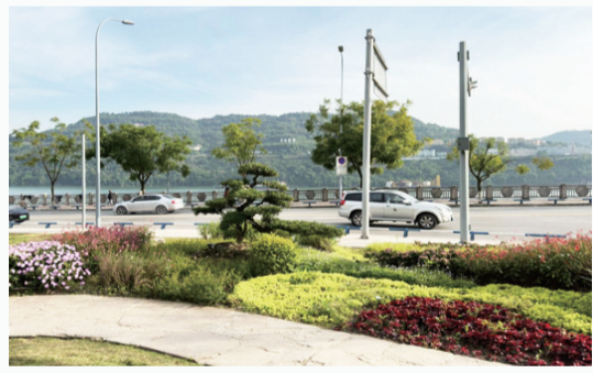
汉阙广场口袋公园小巧精致。