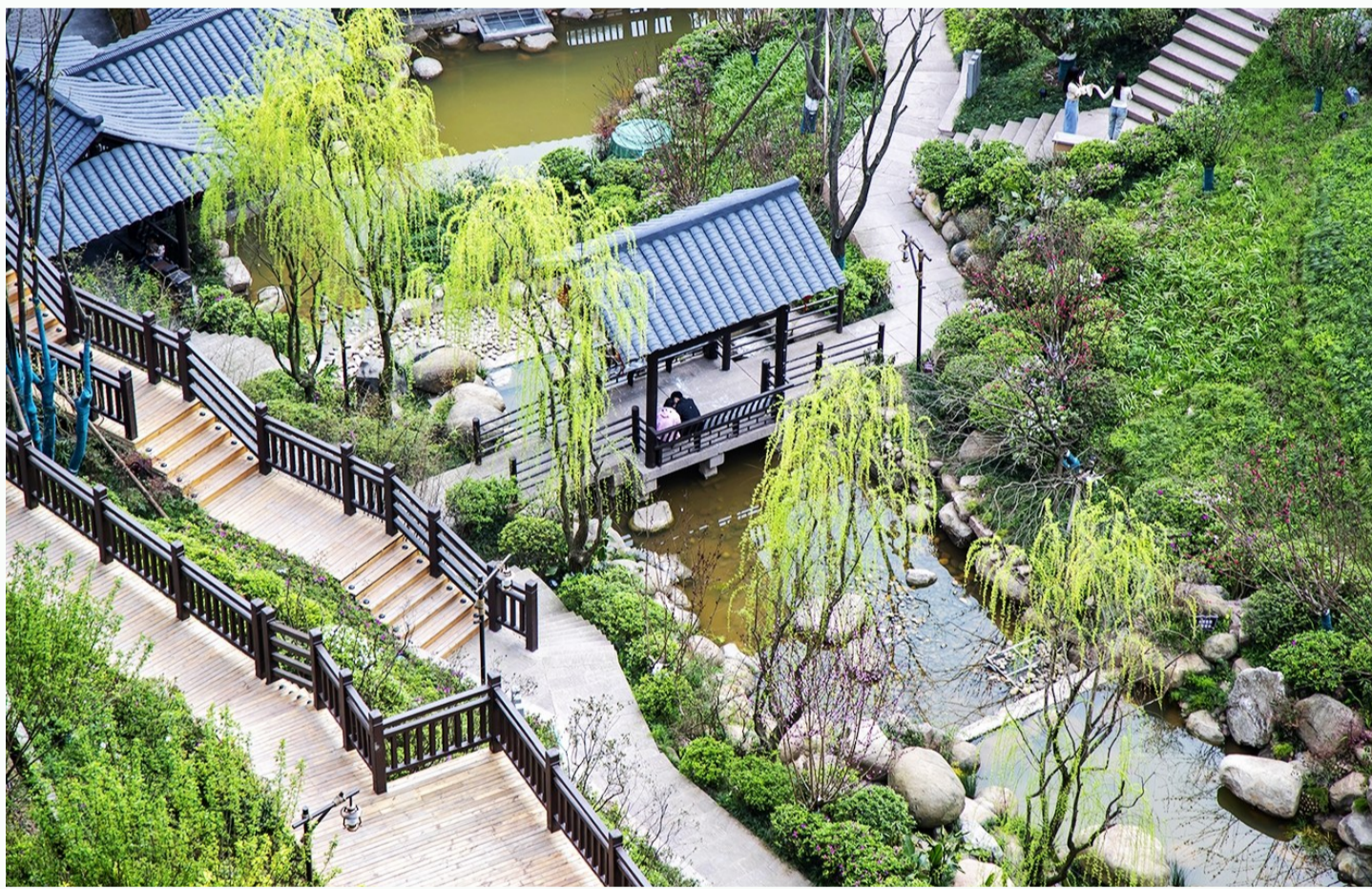
东坡花园诗情画意。