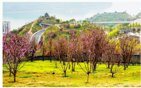
白公生态文化公园景色秀丽。