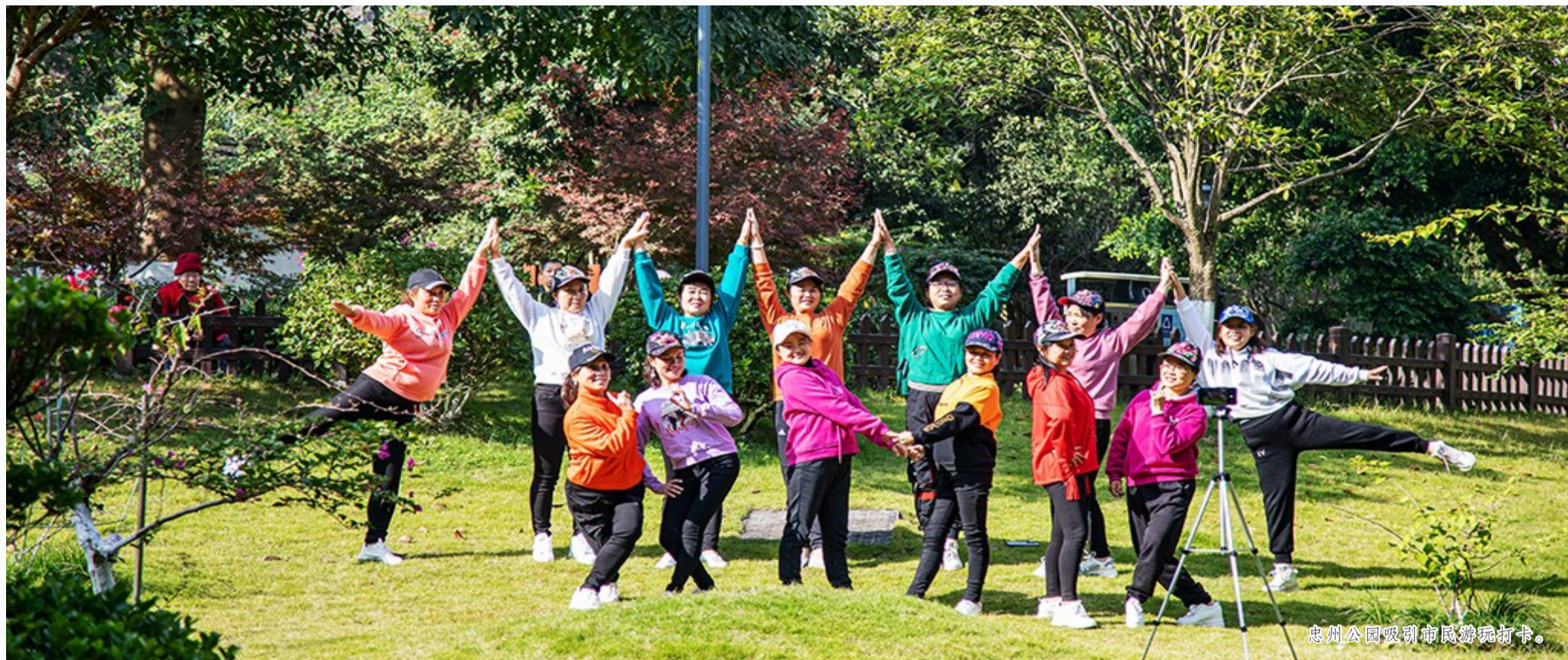
忠州公园吸引市民游玩打卡。