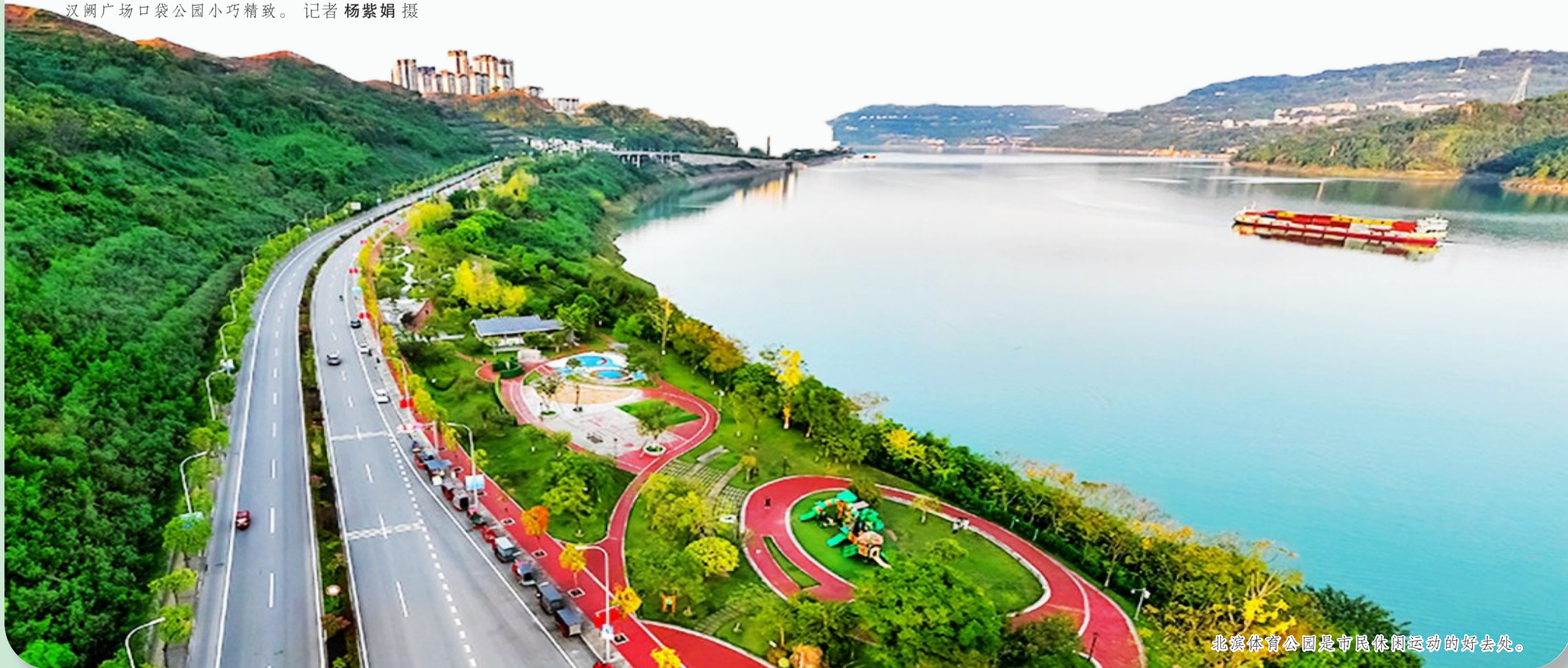
北滨体育公园是市民休闲运动的好去处。