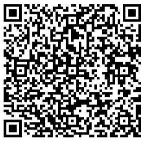
▲长按二维码 提前线上签署《免责声明》

值得注意的是,选手须亲自到场领物,严禁代领。选手们可提前线上扫码签署电子版《免责声明》,领取参赛物品时须携带报名时所用的身份证件原件(二代身份证、护照、港澳通行证、台胞证等)或电子身份证。所有18周岁以下未成年人参赛需选手本人及监护人或法定代理人共同签署电子版《免责声明》(可同时签署2人姓名)。65周岁以上参赛运动员需直系亲属签字确认。参加健康跑亲子组项目的未成年选手(13周岁以下)可由其监护人代领。如弃赛,可在参赛本人允许的情况下,让他人代领除参赛号码布以外的其他物资。