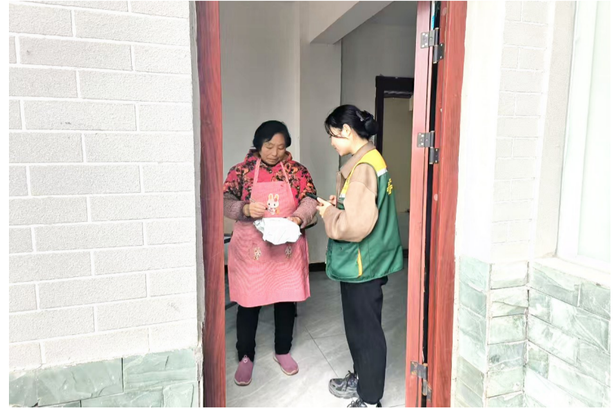
快递服务进村入户。

县邮政公司相关负责人介绍,“邮快合作”以后,县邮政公司还对邮件处理流程进行了优化,通过积极整合资源,增加邮路和调整邮件进出口时间,