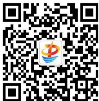
忠州融媒微信公众号