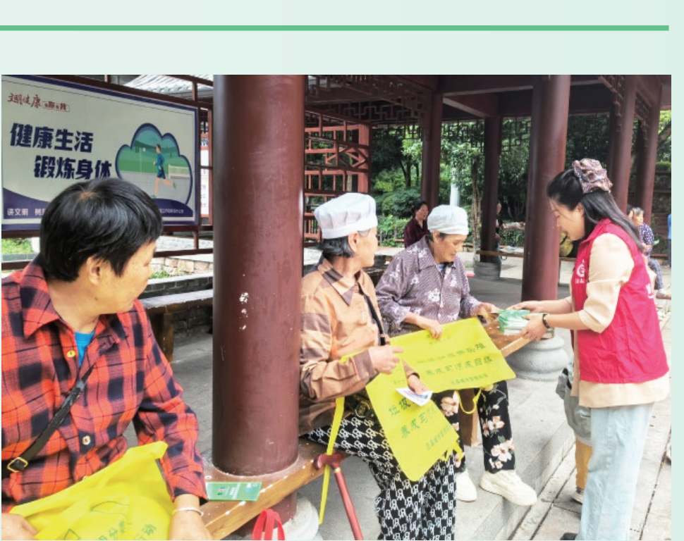
志愿者们向群众发放环保袋和文明礼仪手册。

化巩固、常态长效、追求“增值”的新征程。 荣誉背后非一时突击之功，而依靠于一套“发现—培育—弘扬—转化”全链条的系统工程，将文明内化为城市基因、市民自觉与发展动能。