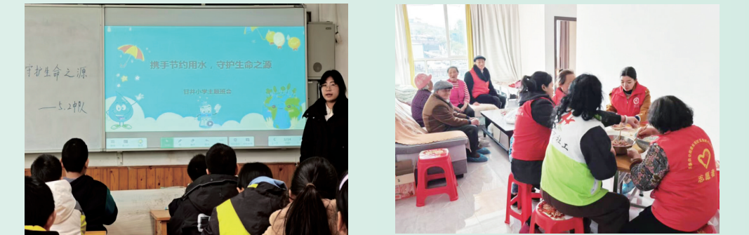
教师利用班会向学生讲解节水常识。