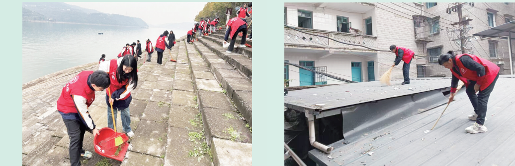
学生志愿者清扫阶梯上的纸屑。