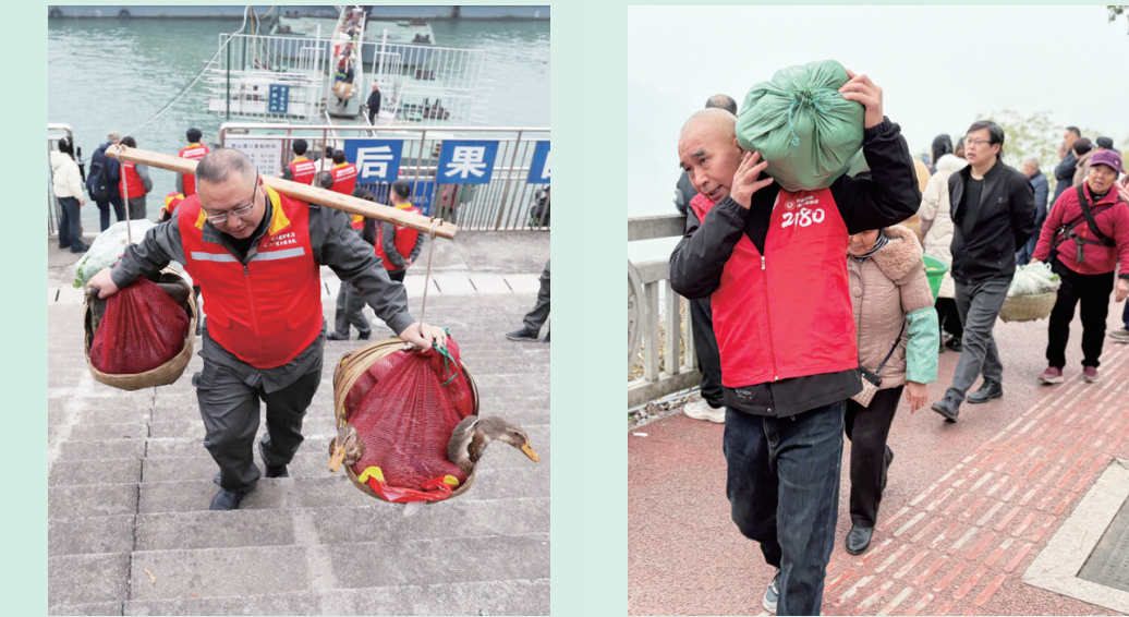
志愿者为“渝忠客2180”客轮上的菜农运送货物。