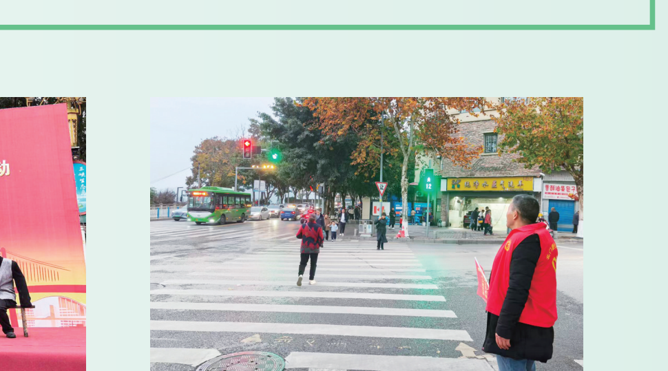
志愿者们引导行人安全有序过马路。

文明创建的成果，最终必须由市民的获得感、幸福感、安全感来检验。忠县一直秉持“创建为民、创建惠民”的理念，将被解民生“微痛点”、满足百姓“小确幸”作为深化全国文明城市建设的根本着力点。 漫步忠县城区，细心会发现许多“小而美”的变化：曾经的闲置边角地、卫生死角，变成了栽花种树、设有座椅的“口袋公园”；老旧小区斑驳的墙面，绘上了展现忠文化或田园风光的彩绘；背街小巷的路灯亮了，农贸市场的秩序好了，人行道上的障碍物被清除了……这些变化，源于一套高效的问题发现与解决机制。