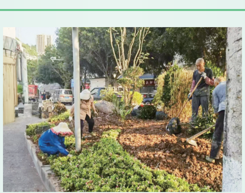
闲置边角地被改造成小花坛。

誉，这座滨江之城已累计拥有国家级文明桂冠16项。 从2017年首度荣获“全国文明县城”荣誉称号，到如今多项荣誉叠加、文明硕果累累，忠县的文明建设已走过“奇牌”阶段，步入深