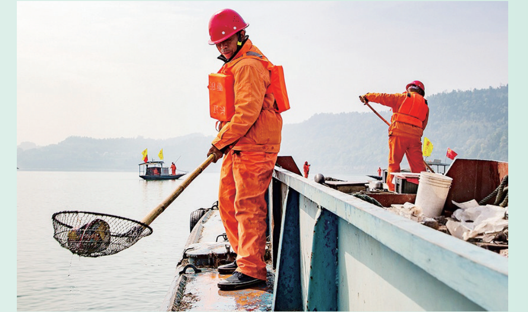
清漂人员打捞江面上的垃圾。