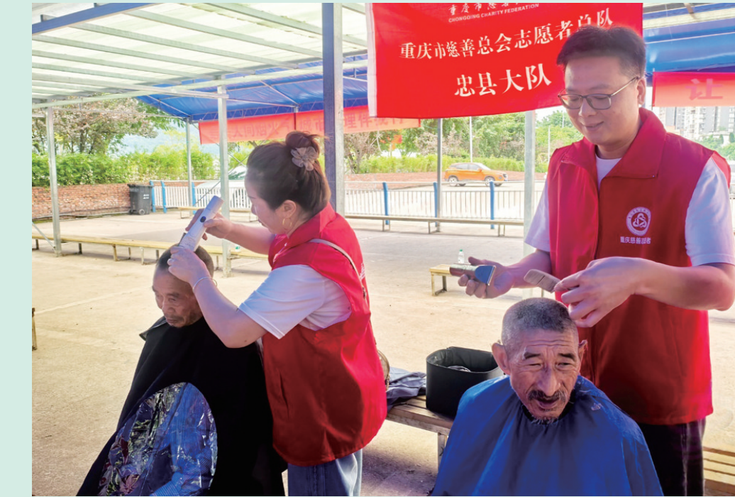
志愿者为老人义务理发。