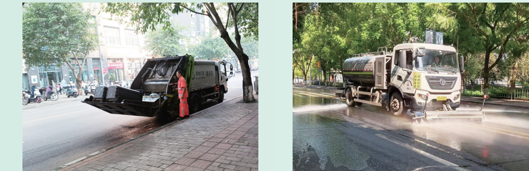
洒水车按时清运垃圾。