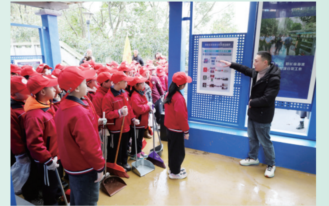
青少年学习环保知识。