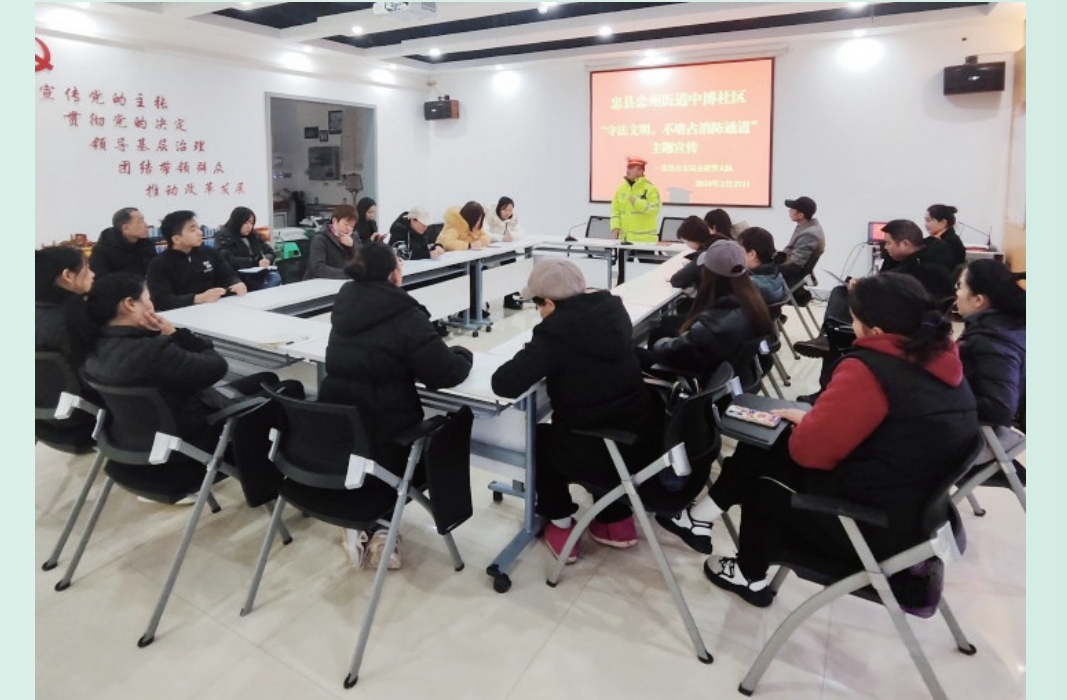
交警向社区干部群众宣讲文明出行知识。