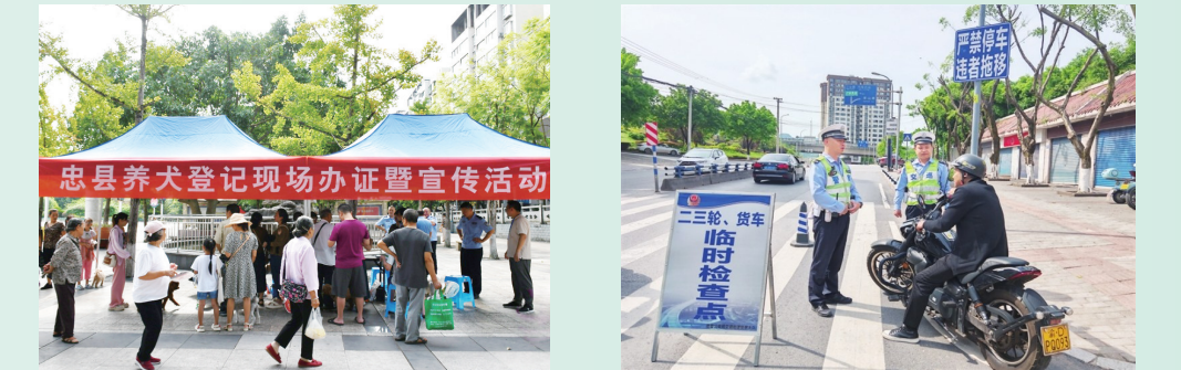
县公安局开展文明养犬宣传活动。