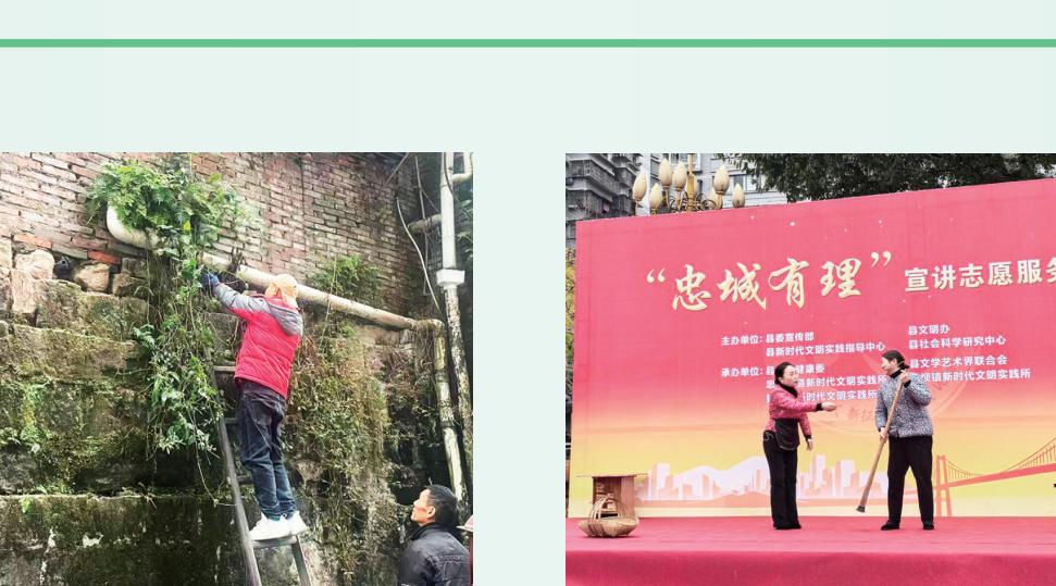
多单位联合开展“忠城有理”宣讲志愿服务活动。

文明创建的成果，最终必须由市民的获得感、幸福感、安全感来检验。忠县一直秉持“创建为民、创建惠民”的理念，将被解民生“微痛点”、满足百姓“小确幸”作为深化全国文明城市建设的根本着力点。 漫步忠县城区，细心会发现许多“小而美”的变化：曾经的闲置边角地、卫生死角，变成了栽花种树、设有座椅的“口袋公园”；老旧小区斑驳的墙面，绘上了展现忠文化或田园风光的彩绘；背街小巷的路灯亮了，农贸市场的秩序好了，人行道上的障碍物被清除了……这些变化，源于一套高效的问题发现与解决机制。