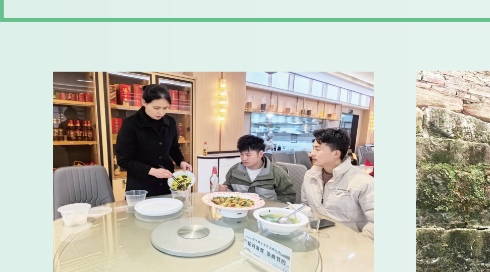
服务员为顾客打包食物，避免浪费。

布新一届全国文明城市、文明村镇、文明单位、文明校园及家庭名单，忠县再度荣列“全国文明城市”名录。与此同时，忠县新增3个全国文明城市“金字招牌”的真正内涵。 就在前不久，中央精神文明建设办公室公