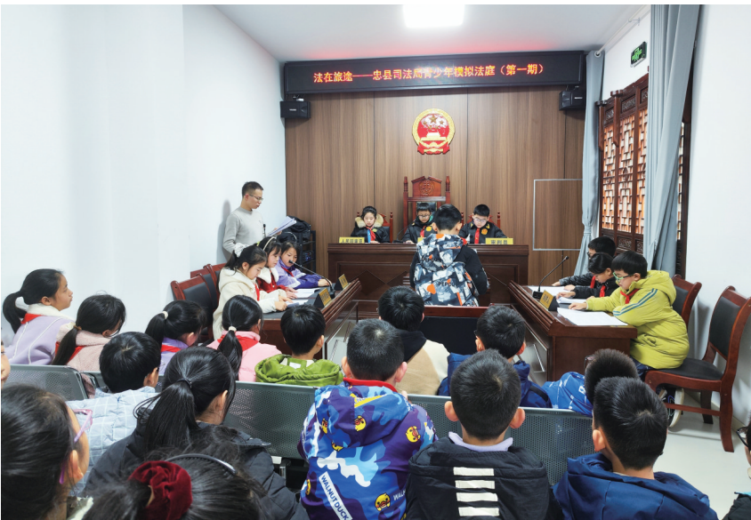
学生体验模拟法庭。

12月24日，忠县50余名小学生前往白公祠文博景区参观“居然后易学”法治文化体验馆。