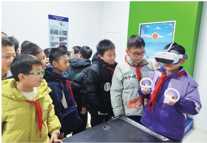
学生通过VR设备学习法律知识。

作为忠县司法局重点打造的普法载体，该体验馆以“旅游+法治”的创新模式，将现代法治文化与白居易“关注民生、追求公正”的执政思想深度融合，让游客在游览中感受法治温度，是全国少有的嵌入文物保护单位的法治教育场所。体验馆精心设计了白居易法学思想展览馆、青少年模拟法庭、青少年法治学习互动室和青少年普法互动室等4个功能室。